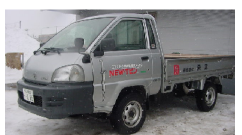
森忠唯一のトラック。見た目以上によく活躍しています。若井産業NEW-TECのロゴ入りは世界でただ1台。配送車(臨時便)