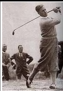
球聖 ホ'ビー・ジョ'ンス 1902年-1971年

その昔、スコットランドの海辺の荒野で羊飼いが棒切れで小石を打って野兎の巣穴に入れることを競ったという。ゴルフが生まれ、ようやく形が出来てきた頃、打ち出しの場所(ティインググラウンド)にてキャップ一杯のウイスキーを飲むことが許され、18杯目で小瓶が空になったためワンラウンドが18ホールとなったとか、ならなかったとか。