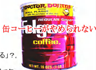
缶コーヒ'がやめられない

さて、初めて書かせて頂きます。新人のOです。私の記事は『ちょっと気になる話』を紹介したいと思います。初回の話は『缶コーヒーを飲むと「逆に眠くなる」?』です!