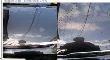
洗車の王国 ファインクリスタル 洗車機